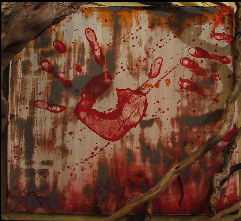
“senza titolo” MB 2002