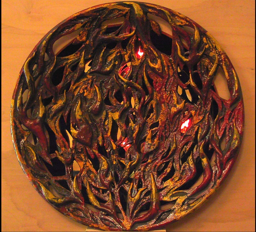
"FUOCO" JAN 2002